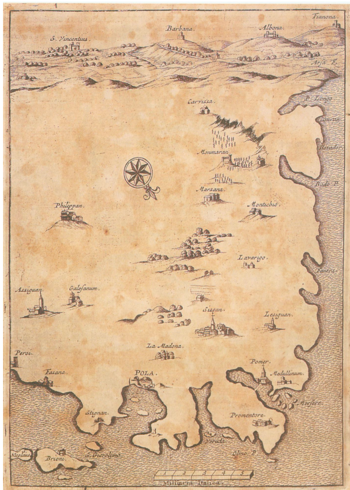
Sl. 1: Crtež južne Istre iz 30-ih god. XVII. stoljeća, s ucrtanim položajem Pule, Premanture, Peroja i Mutvorana (Miroslav BERTOŠA, Istra: Doba Venecije, nav. dj., str. 416.)

Giacomo Contarini stigao je u Puljštinu, gdje je trebao nagovoriti hajduke da napuste posjede u Campanošu, dati im druge kao zamjenu te odrediti mjesto gdje će hajduci podignuti svoje selo. U prvoj je namjeri uspio, ali je hajducima morao obećati da će moći ubrati ljetinu koju su te godine zasijali ili će im država nadoknaditi istu količinu žitarica.